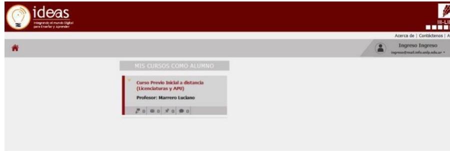
Figura 6. Acceso al curso en la pantalla inicial después de iniciar sesión.