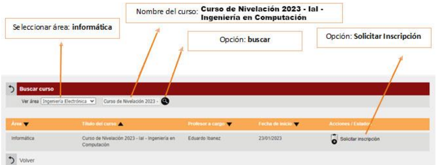
Figura 5. Curso para Introducción a la Informática (IAI) , carrera de Ingeniería en Computación . Opción: “solicitar inscripción” .