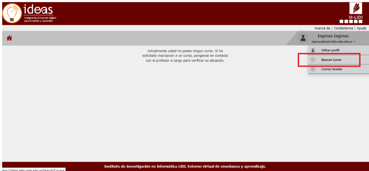
Figura 2. Pantalla inicial del usuario en sesión en donde se puede visualizar la opción “Buscar Curso”.